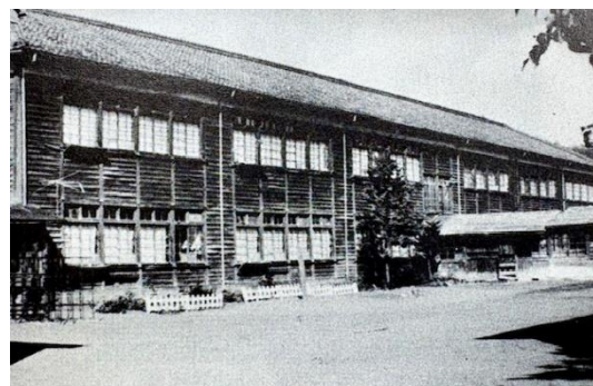
分散教育の第三校舎（昭和12年から）