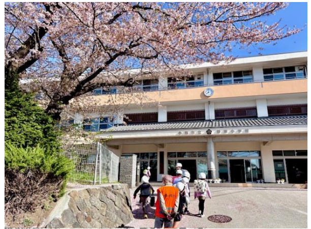
現在の野岸小(R7春) もうすぐ春がやってくる