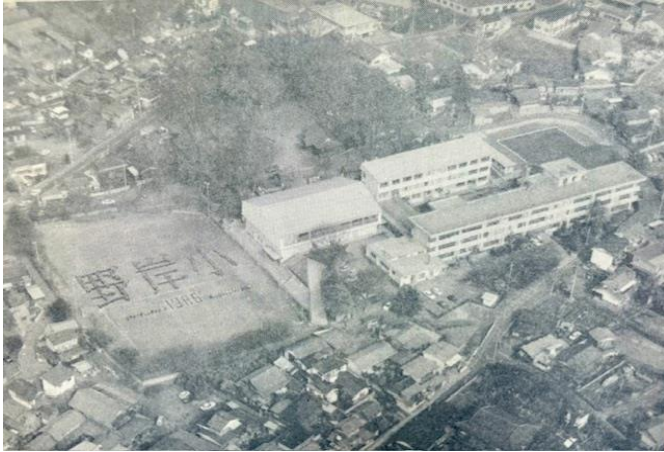
開校50周年記念資料より（当時の校舎）

野岸小学校が皆様にお支えいただき地域からとても大切にされてことを実感し、毎日元気に通ってくる素敵な子どもたち一人ひとりを大切にする野岸小学校であり続けたいと改めて思いました。最高の野岸小学校が継続するように、職員一丸となり子どもたちのために努めてまいります。