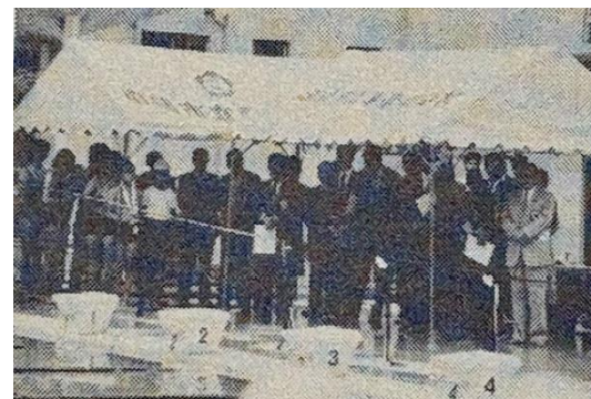
新プール完成（昭和61年）