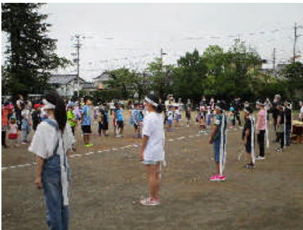
▲開会式の様子(野岸小学校)

新型コロナ対応で、今までの運動会と同じめあてでできる行事として、今年度初めて開催しました。当日は、薄曇りでしたが、逆に汗だくにならずにできました。6年生の応援団と、管楽部のファンファーレで、3箇所のスタート場所からそれぞれのコースでラリーを開始しました。「全ポイントを巡るぞ」「最初はこのポイントで、余裕があったらここも」「ここまで行って帰ってくる」「あそのポイントだけは絶対行く」など、それぞれの子が自分なりに考えたコースを、おうちの方と一緒に回りました。「うちの子、結構走るの速いですね」「歩くと、今まで通り過ぎていたところに気づいて勉強になりました」「大人は運動不足ですね」など、おうちの方の感想もたくさん聞くことができました。場所をお借りしたポイントでも、協力してくれたり、応援してくれたりしてくれました。保護者の皆様をはじめ、多くの方々のご理解とご協力で実施することができました。運動会の完全な代替行事とはいきませんが、「こんなこともできそうだ」「こうすればもっといいかも」など、新たな取り組みへのつながりや広がりのある行事でもありました。アフターコロナの参考になりそうです。ありがとうございました。