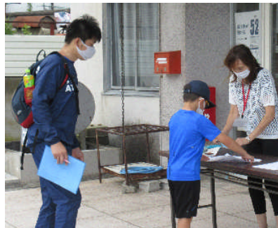
▲スタンプを押してもらいます