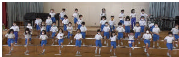
<1年生の歌の発表「さんぼ」>

6年生が計画しようとした途端に休校になってしまって、できずにいました。なんとか歓迎の気持ちを伝えたいということで、3密を避けるために、校内テレビ放送を使って計画してくれました。テレビの中の6年生の合図で、各クラスにいる全校が歌を歌ってスタートしました。6年生が学校生活の紹介を劇に見せてくれました。1年生もビデオ撮影で歌を披露してくれました。マスクのまま歌っていたので、マスクを取った顔も写して紹介してくれました。思いを伝える工夫がいっぱいつまった、温かい1年生を迎える会になりました。6年生の皆さんありがとうございました。